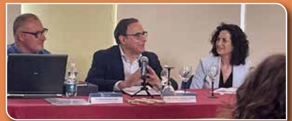
Acto inaugural, alcalde de Alhama, rector de la UAL y organizadora de las Jornadas.

dad de la Universidad de Almería (ejes I y II) y con los objetivos del Milenio para el Desarrollo Sostenible, a través de un programa ambicioso que bajo una perspectiva jurídica, histórica y arqueológica se ha facilitado un conocimiento experto que ha contribuido a una mejor comprensión de la condición de la mujer a lo largo de los siglos.